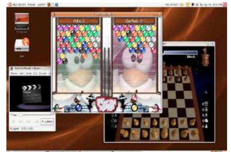
Massvis med spel, underhållning och multimedia