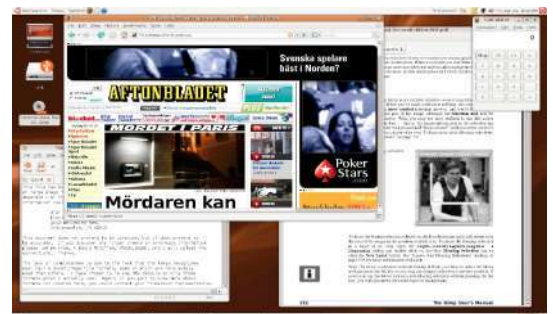
produktiv i en gratis och virusfri miljö.